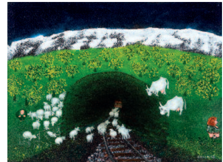
Rechts: Schafe im Tunnel , 2008 Öl auf Hartfaser