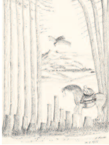
Oben: Pferd mit Reiter in der Baumlichtung , 1988 Bleistift