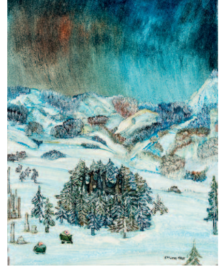
Mitte: Der Brunnen in der Wiese , 1976 Öl auf Hartfaser