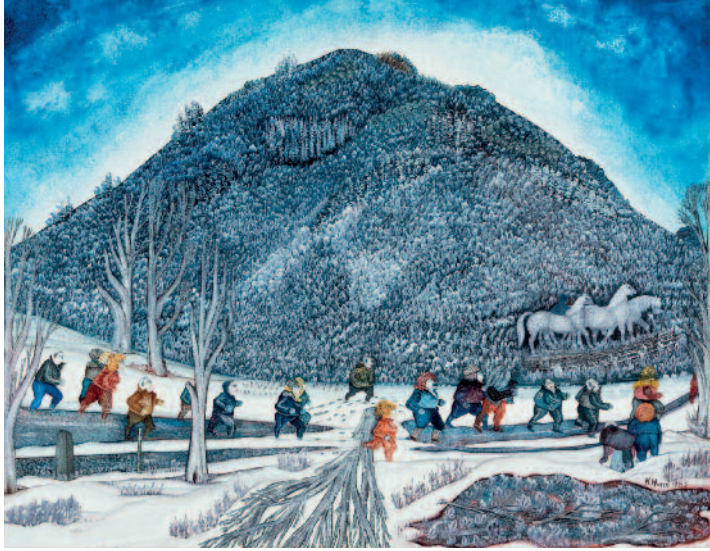
Titel: Hohenzoller , 2011 Öl auf Hartfaser