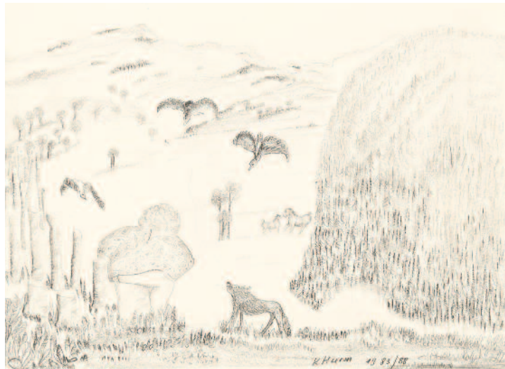
Unten: Fuchs mit Frau und Vögeln , 1983/88, Bleistift