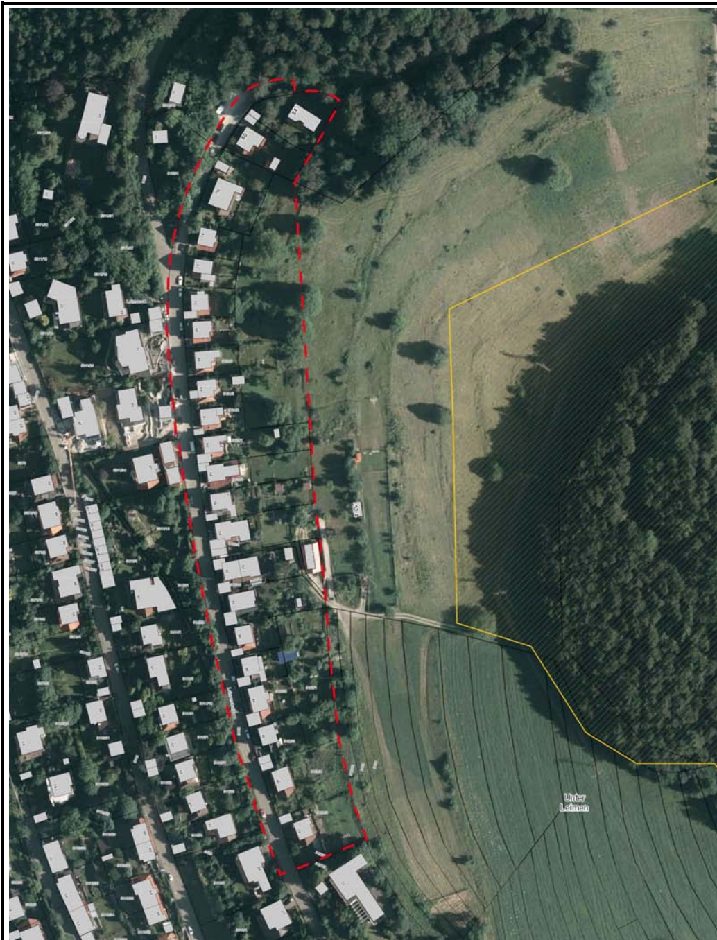
Abbildung 2: Lage des Bebauungsplangebietes zum FFH-Gebiet „Gebiete um Albstadt“

(z.B. mangelnde Unterlagen zur Beurteilung der Wirkungen oder Hinweise auf Maßnahmen, die eine Beeinträchtigung von Arten, Lebensräumen, Erhaltungszielen vermeiden könnten)